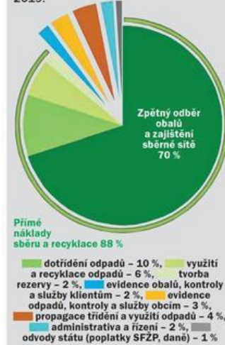
Struktura nákladů AOS EKO-KOM v roce 2019:

Prostřednictvím sběrných systémů obcí se tak shromáždilo přes 693 tisíc tun vytříděných odpadů, což je o 4 % více než v roce 2018. Spolu se živnos-