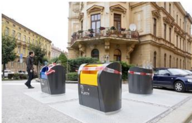
Toto jsou nové podzemní kontejnery za skoro milion korun. Někteří jhlavští radní se nyní diví, jak špatně vypadají vedle historických domů.

Barevné popelnice k rodinným domům a větší dotřídování směsného odpadu jsou hlavními návrhy Eko-komu, společnosti odpovědné za sběr odpadu. Takto lze pod a dalších odpůrců záloh zvýšit množství vysbíraných PET lahví a omezit tak odpad jdoucí na skládky.