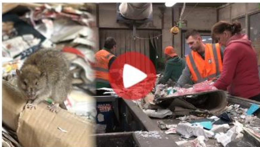
Potkani, mrtvoly, nahé ženy. Tady třídí papír z popelnic | (3:22) | video: Matěj Smlsal, Libor Vacek, INFS.cz

VIDEO: Potkani, mrtvoly, nahé ženy. Tady třídí papír z modrých kontejnerů: