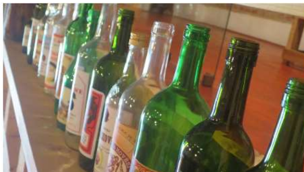
Na třídění skla získají lidé nádoby z pevného plastu