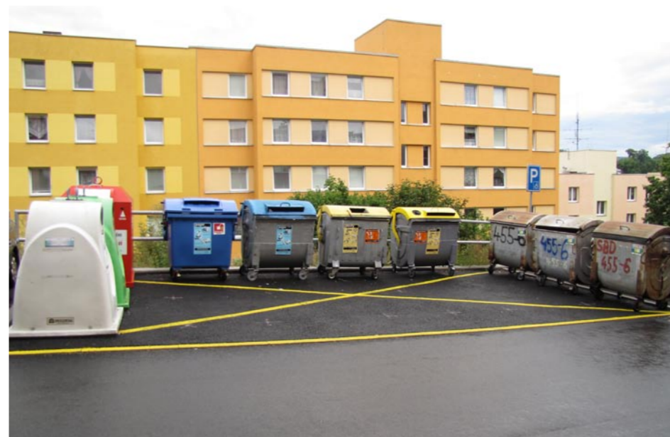
▲ Typické stanoviště sběrných nádob na vimperském sídlišti

hotných surovin. Díky vhodně nastavenému systému sběru využitelných odpadů se jeho výtěžnost dlouhodobě pohybuje nad hranicí 50 kg na obyvatele a rok.