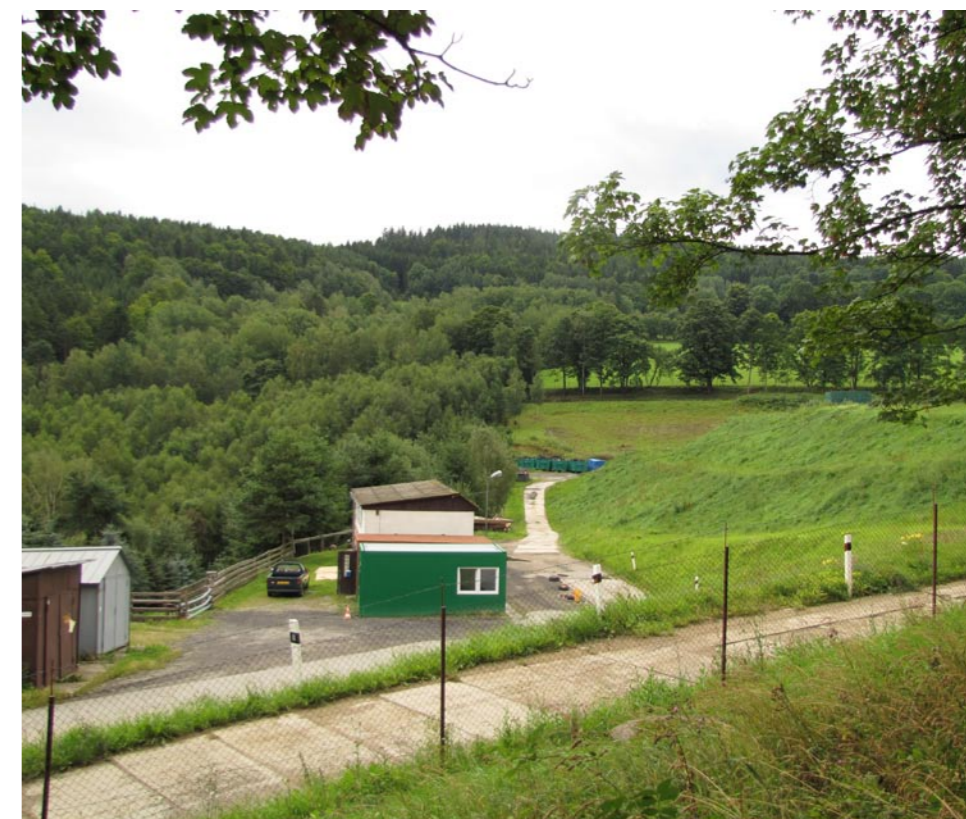
▲ Městská skládka

Jak již bylo řečeno výše, obyvatelstvu a živnostníkům je k dispozici více jak 300 nádob na třídění odpadů, převažují nádoby na papír a plasty, které obsluhují Městské technické služby, nádoby na sklo sváží společnost AMT Příbram, která zároveň zajišťuje následnou úpravu skleněných odpadů. Do systému obce je zapojena vyhláškou i místní výkupna dru-