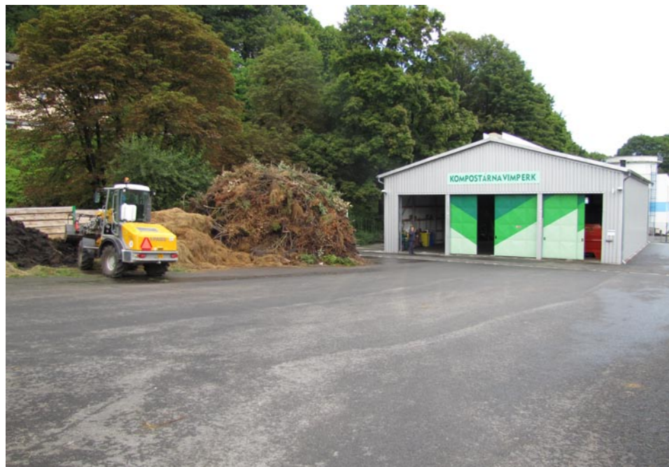
▲ Kompostárna ve Vimperku

cca o tři kilometry dále. Biologicky rozložitelné odpady jsou přijímány v areálu kompostárny, kde se odpad upravuje pomocí drčení a dávkuje do fermentoru. Kompost dozrává na zpevněných plochách v areálu skládky a je použit pro rekultivaci tělesa skládky. Kompostárna může do budoucna produkovat i tzv. energetický kompost, který bude možné využít v blízké tepelně na biomasu.