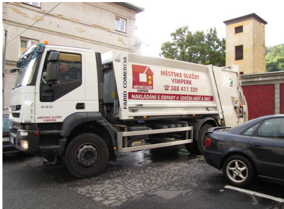
▲ Sběrný vůz Městských služeb Vimperk

Směsný komunální odpad se sváží s frekvencí 1 krát týdně, kromě osad, kde je svoz čtrnáctidenní, přičemž nádoby na odpad jsou majetkem vlastníka nemovitosti. Město díky tomu nemá s nádobami žádný náklad navíc. Městské technické služby navíc zajišťují při svozu i úklid stanišť, tak aby byl ve městě pořádek. Živnostníci mají možnost využívat nádoby na tříděný odpad zdarma na základě smlouvy o zapojení do systému obce. Dlouhodobě je jich zapoje-