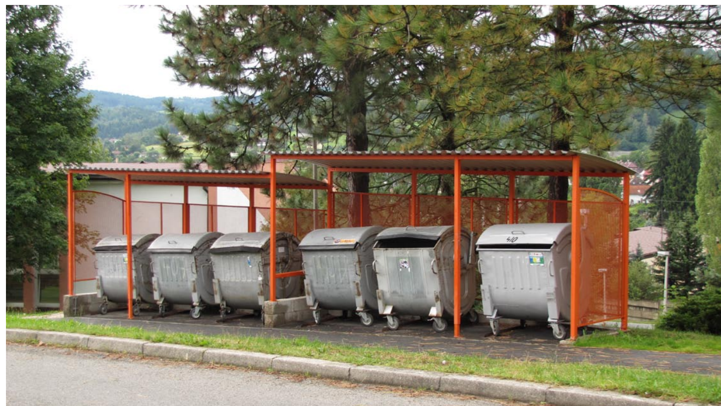
▲ Kryté stanoviště sběrných nádob na směsný komunální odpad