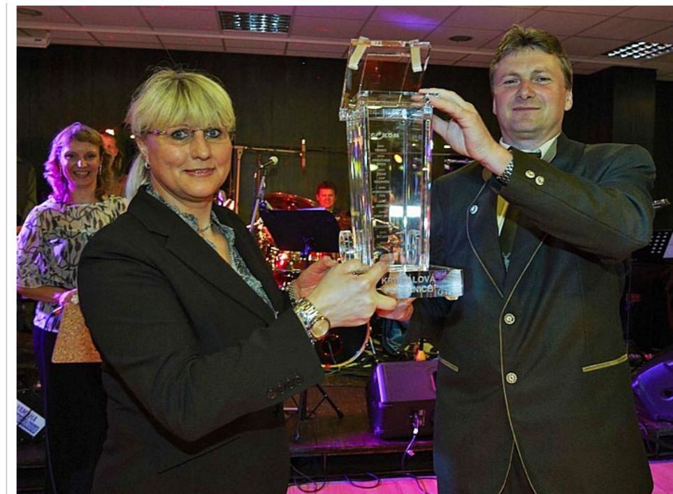
▲ Přebírání putovní Křišťálové popelnice

► Na úvod několik stručných informací. Město Vimperk má zhruba 7800 obyvatel, kteří žijí ve dvaceti místních částech, zhruba třetina obyvatel bydlí na sídlišťích. Průměrná nadmořská výška města je 700 m n. m. a německý původ jména města Winterberg dává tušit, že zima tu bývá krutá. To vše má samozřejmě vliv na správné nastavení systému nakládání s odpady.