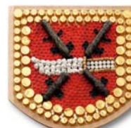
▲ Vojnův Městec

Pojďte si s námi hrát a tvořit. I z odpadů mohou vzniknout hezké věci. ■